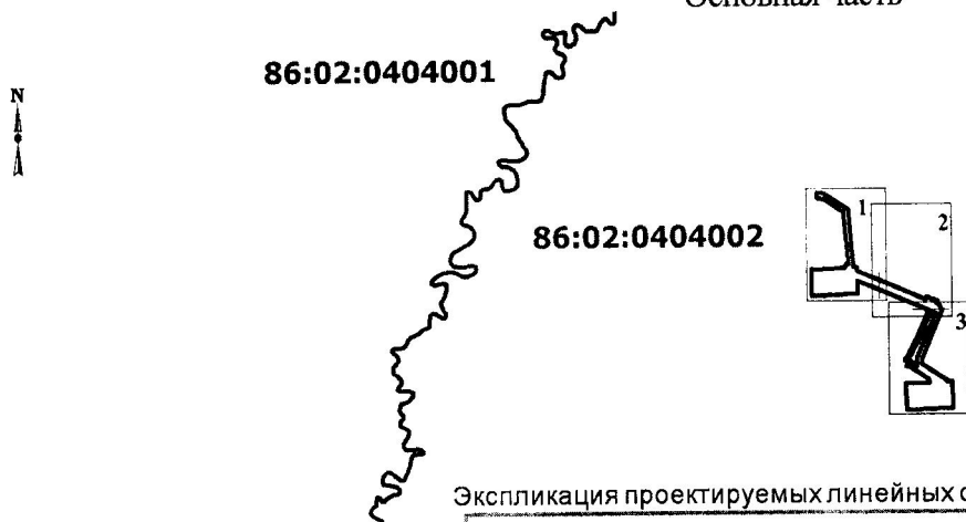
Экспликация проектируемых линейных объектов